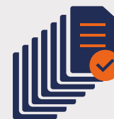
Screenshot neXT® Druckmaske

Automatische Vertragserstellung mit Anhängen, Archivierung und Druck